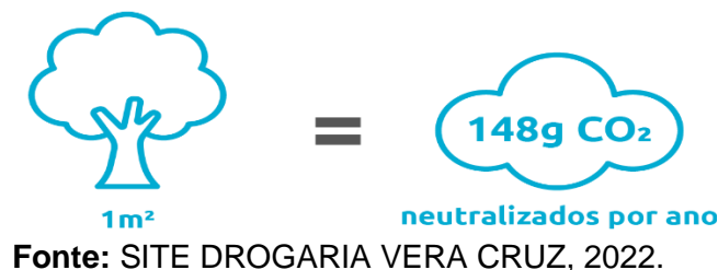
Figura 2 - Relação do plantio de árvores com compensação de carbono Você Sabia?

Em relação aos benefícios do Frete Neutro, primeiramente tem o auxílio ao meio ambiente e a uma causa global. No entanto, no quesito econômico e social, é visto que ter o selo de Frete Neutro faz com que a imagem da empresa seja mais valorizada, justamente por demonstrar que é uma marca que está inteirada com novas tecnologias e desejo de melhoria para a natureza e o mundo em consequência. Ainda, pode-se citar uma terceira consequência, que é a redução de custos, frente ao fato que o planejamento de roteirização pode diminuir gastos desnecessários com transportes (GOULART, 2011; SILVA, 2012; MAGALHÃES, 2013; SOUZA et al., 2021). As Figuras 2 e 3 ilustram a relação de plantio de árvores (ação principal do Frete Neutro) com a compensação de carbono: