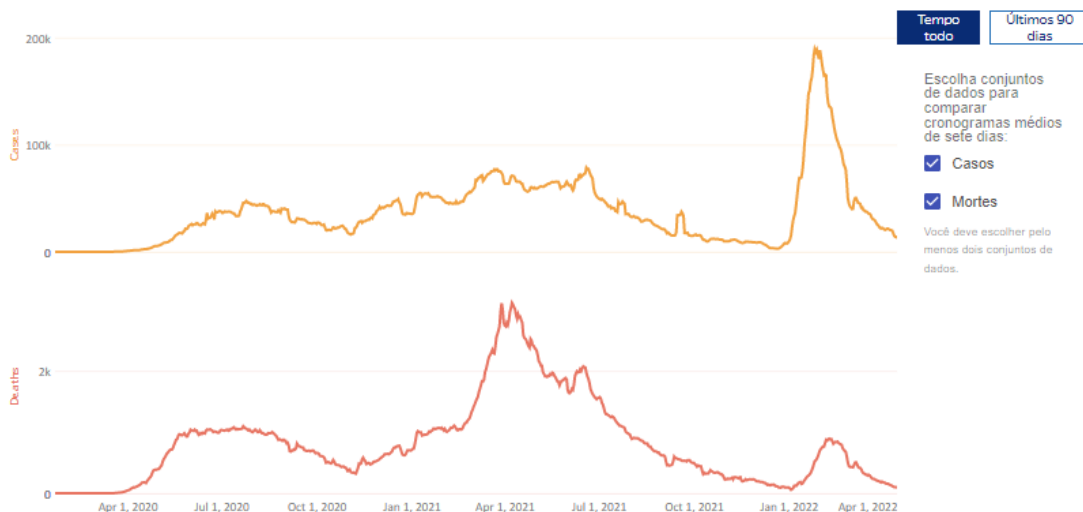
Gráfico 2 – Número de casos e óbitos por Covid-19 no Brasil de abril de 2020 a abril de 2022 Comparações de linha do tempo